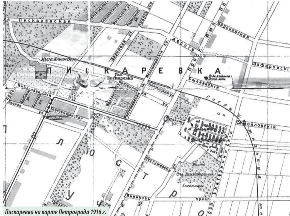
Пискаревка на карте Петрограда 1916 г.