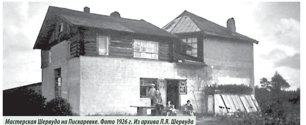
Мастерская Шервуда на Пискаревке. Фото 1926 г.

проспект. Назван Меншиковский проспект в 1903 году к 200-летию Санкт-Петербурга в честь сподвижника Петра I, первого губернатора Санкт-Петербурга Александра Даниловича Меншикова. На довоенных картах Ленинграда (1939) начало проспекта (подпи-